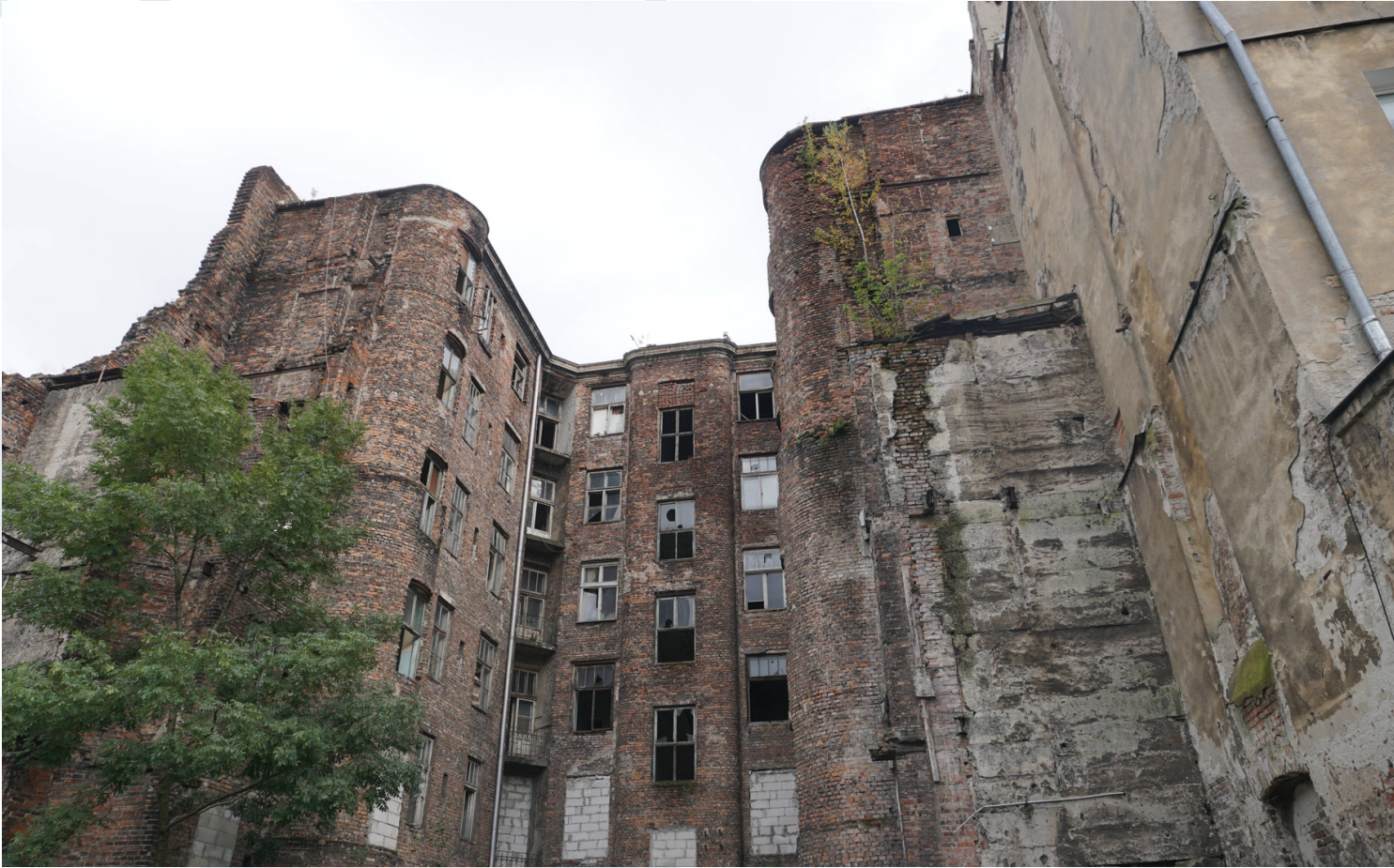
Warsaw: A City Divided - Warszawa: Miasto Podzielone Eric Bednarski 2009, 70 min.

Vuonna 1941, pian Varsovan gheton perustamisen jälkeen, puolalainen amatöörielokuvantekijä kuvasi 8mm:n filmin gheton muurien molemmilta puolilta. Tämä ennennäkemätön kuvamateriaali on kudottu "Warsaw: A City Divided" - elokuvaan, ja se on hiljainen todistaja sodanaikaisen jaon ja kaupungin tuhon sekä sen asukkaiden murhien tragediasta. Gettosta eloonjääneet ja silminnäkijät kertovat erikoisia muistojaan, kun taas arkkitehdit ja kaupunkihistorioitsijat tutkivat natsi-Saksan pelottavaa visiota Varsovasta. Dokumenttielokuva, jossa rikas menneisyyden aineisto kietoutuu yhteen nykypäivän Varsovan, sen ihmiskasvojen ja kaupunkirakenteen kanssa, vahvistaa muistamisen tärkeyttä - ja vaikeutta -.