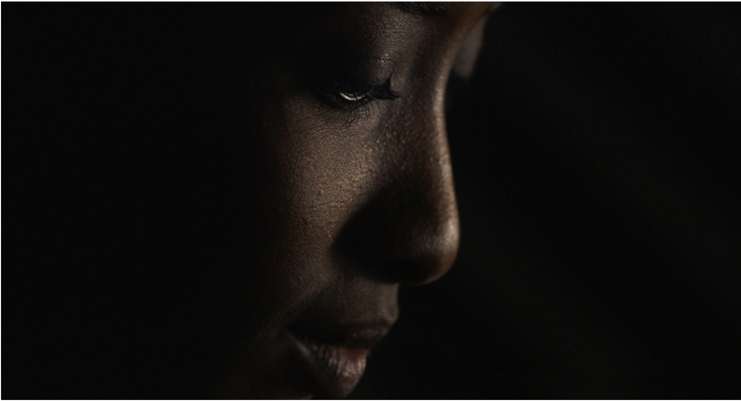
Easy Lessons - Könnyű leckék Dorottya Zurbó, 2018, 78 min.

"Easy Lessons" on runollinen matka kauniista, nuoresta tytöstä, Kafiasta, joka aikuisuuden kynnyksellä eroaa kaikesta siitä, minkä kanssa hän kasvoi Somaliassa. Kulttuuriset arvot, tabut ja dogmit hajoavat mitä sattumanvaraisimmissa tilanteissa, kun hän yrittää sopeutua uuteen elämään Euroopassa, Unkarissa. Hänen äitinsä auttoi häntä pakenemaan kohtalooaan, mutta miten hän voi selittää läpi elämäänsä muutoksia rakkaimmalleen? Hän haluaa tehdä sen velvollisuudentunnosta tai ylönousemuksen halusta, mutta miten... Tästä sisäisestä kamppailusta tulee itse elokuva ja ehkä ainoa tunnustuksen muoto.